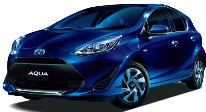
Photo:特別仕様車S"Style Black"(ベース車両はS)。ボディカラーのダークブルーマイカ(8S6)は特別設定色。内装色は特別設定色のブラック。